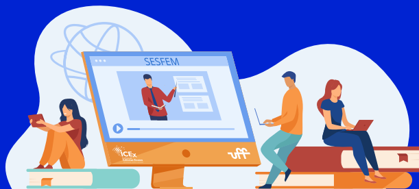
Práticas educativas em ensino remoto