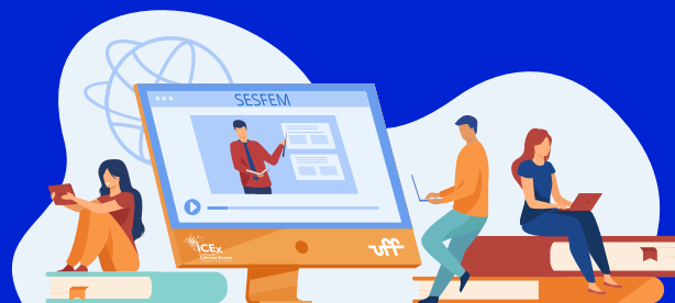
Práticas educativas em ensino remoto